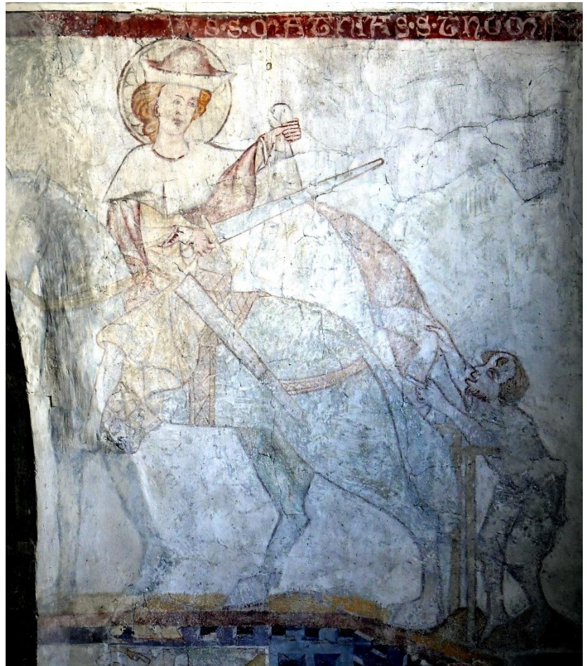
Alt-St. Martin Garmisch