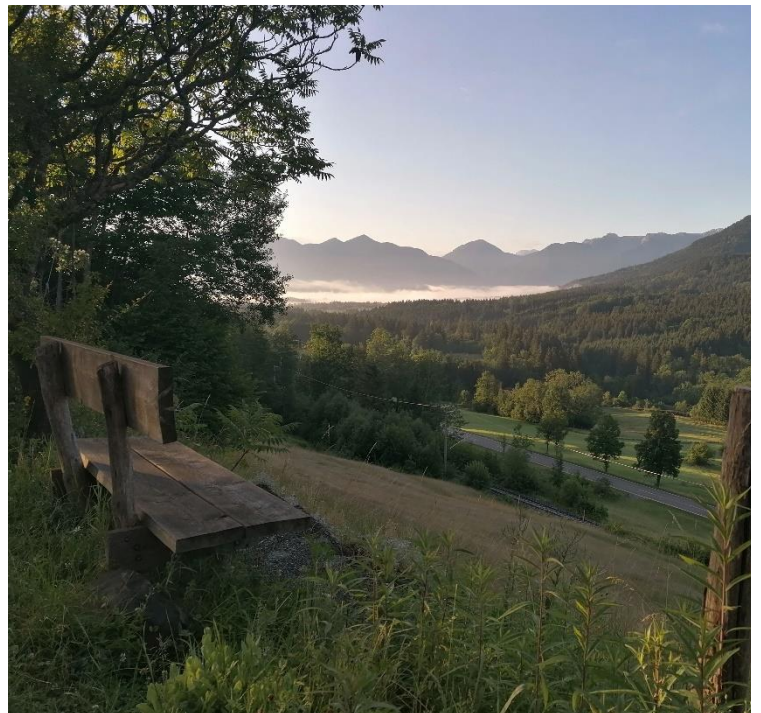
Blick auf Murnauer Moos