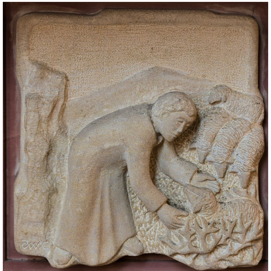
Relief im Altarstein St. Martin Bad Lippspringe

Ich wünsche uns allen, besonders den Frauen und Müttern am heutigen Muttertag, einen gesegneten Sonntag und eine gute Woche! Christine Sosna, Gemeindereferentin