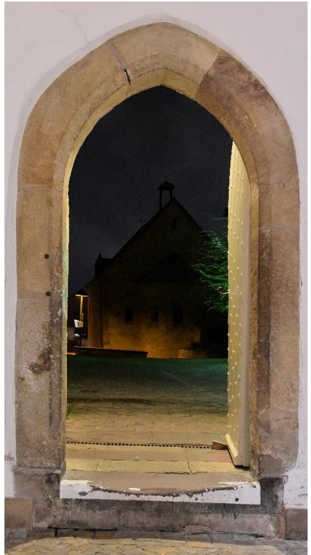
Blick aus dem Kreuzgang, Dom zu Paderborn

„Mitten unter euch steht der, den ihr nicht kennt.“