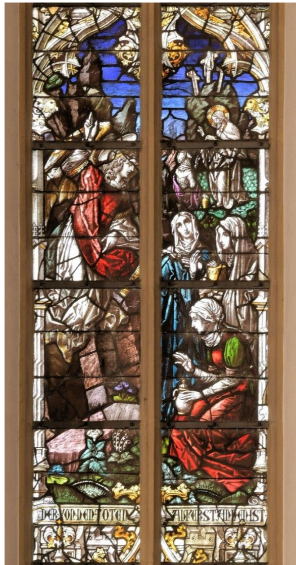
Heilig Kreuz Altenbeken

WIR WÜNSCHEN ALLEN GEMEINDEMITGLIEDERN UND GÄSTEN EIN FROHES UND GESEGNETES OSTERFEST!