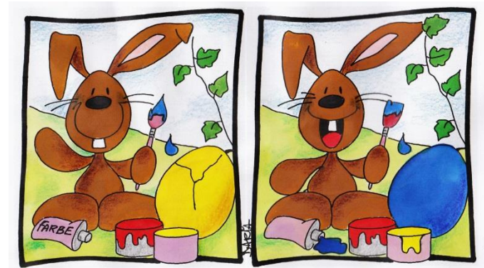
Suchbild Osterhase von Daria Broda aus pfarrbriefservice

„Am ersten Tag der Woche gingen die Frauen mit den wohlriechenden Salben, die sie zubereitet hatten, in aller Frühe zum Grab. Da sahen sie, dass der Stein vom Grab weggerollt war ...“